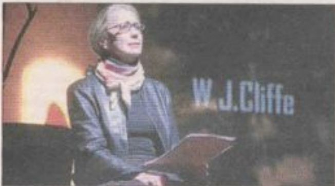
La mise en scène minimaliste permet de se focaliser sur la richesse du texte.

Ce texte complexe a trouvé un écho favorable auprès du public des Pipots qui a longuement salué la performance des deux artistes. ■ R. V.